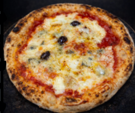
LA 4 FROMAGES